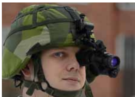
Bildförstärkare kan bäras med eller utan hjälm.

Bildförstärkarna som levererades till Försvarsmakten i februari kan bäras på huvudet både med och utan hjälm och