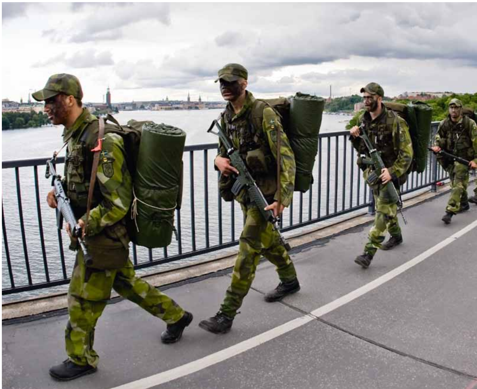
Förändringsarbetet i Försvarsmakten håller hög takt.