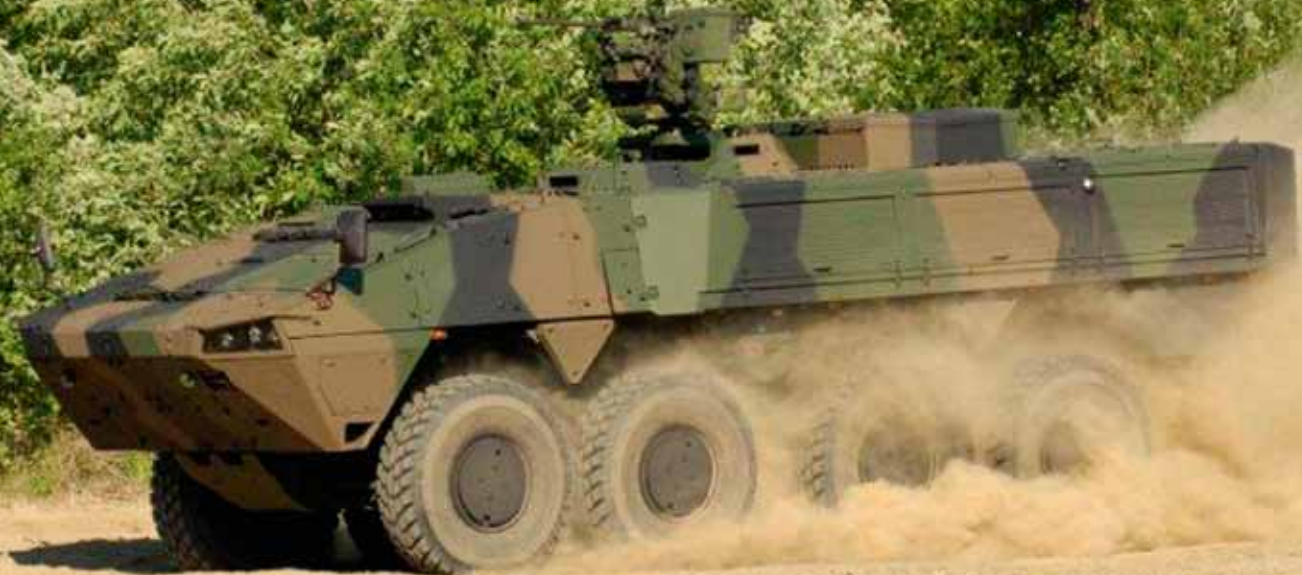
Pansarterrängbil 360 levereras till Försvarsmakten under 2013.

U nder 2012-2013 kommer ny utrustning att levereras till Försvarsmakten. Pansarterrängbil 360 och mörkersensorer är några av nyttillskotten.