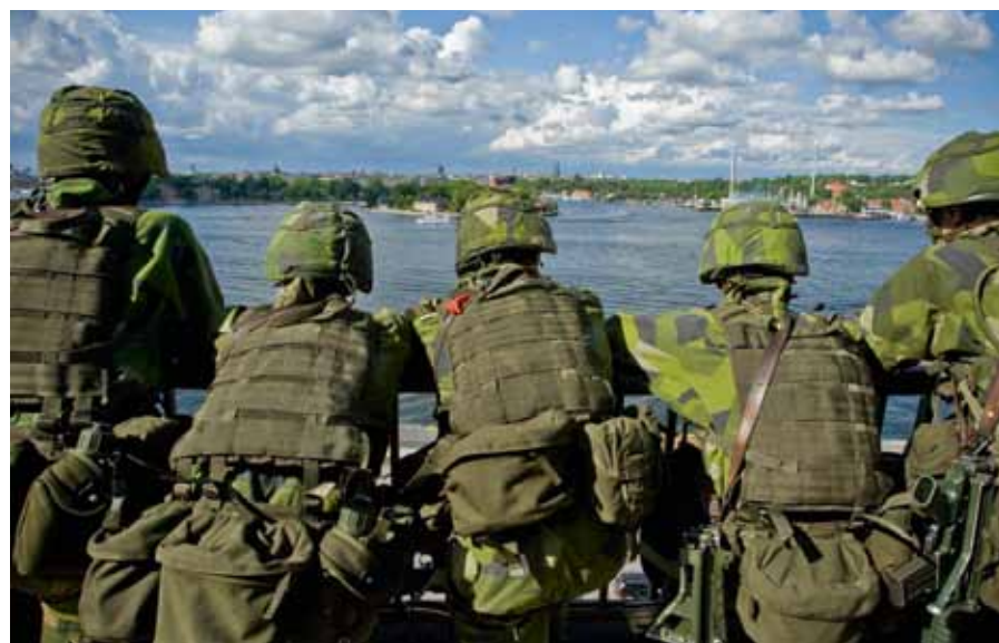
All personal i Försvarmakten får nu vänta på besked om sin befattning.