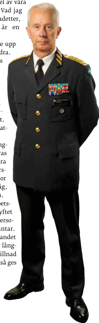
Sverker Göranson Överbefälhavare

Arbetet innebär att några kan få byta arbetsort, några kanske väljer att sluta även om syftet med omstruktureringen inte är att reducera personalen. Det är en ansträngande tid som väntar. Men den är nödvändig för det fortsatta skapandet av en reformerad och ny försvarsmakt som är långsiktigt hållbar. En försvarsmakt som gör skillnad och där alla som är besjälade av att bry sig också ges bästa förutsättningar att göra just det.