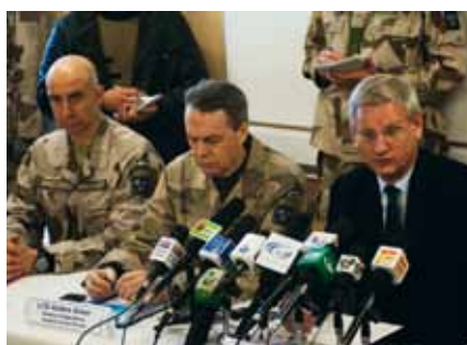
Utrikesministern fick många frågor om det fortsatta svenska engagemanget i Afghanistan.

andra länder, lovat ett långsiktigt och uthålligt stöd till Afghanistan för utveckling och samhällsbyggande. När afghanerna själva tar ansvar för säkerheten ska den svenska insatsen inriktas på ökat civilt stöd.